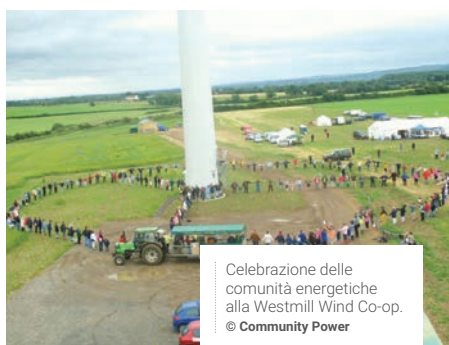
Celebrazione delle comunità energetiche alla Westmill Wind Co-op.

In tutta Europa esistono diverse risorse e reti per gli enti locali progressisti che desiderano fare parte della transizione energetica. Il presente documento fornirà una panoramica delle diverse fasi del processo e delle leve disponibili per diventare un sostenitore dell'energia comunitaria, sia che si lavori per un comune, sia che si desideri collaborare con uno di essi.