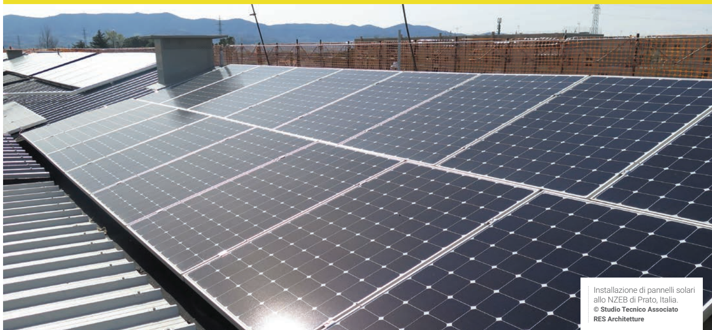
Installazione di pannelli solari allo NZEB di Prato, Italia. © Studio Tecnico Associato RES Architetture

L'impianto centralizzato è costituito da una termopompa e produce 12.701 kWh / anno. È alimentato da 100 pannelli fotovoltaici. All'interno dell'edificio il calore viene distribuito tramite pannelli a pavimento, mentre i pannelli solari sono utilizzati per il riscaldamento e la produzione di acqua calda. Gli edifici sono altamente efficienti, grazie a un tetto coibentato e ad impianti termici avanzati, mantenendo le famiglie al caldo in inverno e al fresco in estate.